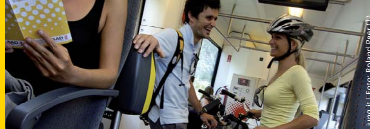
jung.it | Foto: Roland Peer (1)