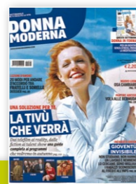
Allegato Alto Adige

Descrizione: Donna Moderna è il settimanale femminile leader per diffusione e lettori.