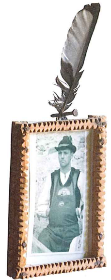
Sarner Trachten gehören zu den schönsten des Landes. Viele Frauen tragen sie heute noch an Sonn- und Feiertagen.