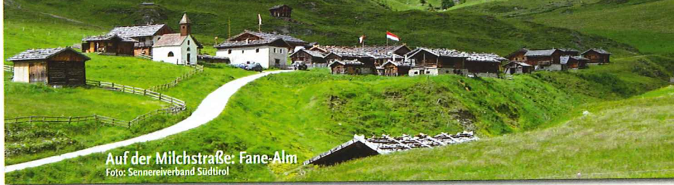
Auf der Milchstraße: Fane-Alm

Südtirol, das ist Vielfalt und Gegensätzlichkeit, alpin und mediterran, traditionell und modern. Eine Symbiose, die sich durch alle Bereiche hindurchzieht, die Land, Menschen und Lebensgefühl charakterisiert. Eine Mischung, die in der Sprache ebenso deutlich wird wie im Alltagsleben, im Flair der Städte, im Brauchtum des Landes und vor allem in seiner Küche und den Produkten.