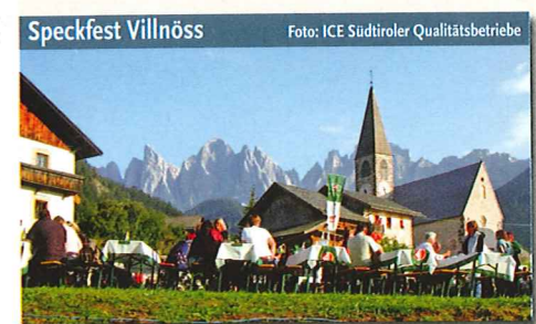
Speckfest Villnöss