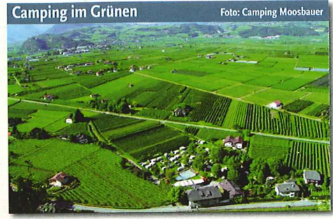
Camping im Grünen

die auch Leckeres rund um Marillen, Erdbeeren, Lamm und Wild bieten ( www.vinschgauer-spezialitaetenwochen.it ). Derweil locken Terlan und Umgebung mit der Spargelzeit von Anfang APRIL bis Ende MAI. Der sandige Boden und das milde Klima im Etschtal sorgen dafür, dass die zarten Sprossen bereits ab Ende März geerntet werden können ( www.suedtirols-sueden.info ). Gut 100.000 Besucher lockt alljährlich das Speckfest an, das traditionell im MAI auf dem Waltherplatz in Bozen stattfindet. Der Zeitpunkt ist kein Zufall: In der Vergangenheit wurde um Weihnachten geschlachtet, und nach einer Reifezeit von 5 Monaten der »neue« Speck angeschnitten. Vier Tage lang heißt es feiern und von Musik animiert den Speck in allen nur denkbaren Variationen probieren ( www.speckfest.it ). Auch die Bozener Weinkost fällt in diesen Monat, während der an 3 Tagen mehr als 300 Kellereien und Weingüter Tür und Tor öffnen und mehr als 300 lokale Weine verkostet werden können ( www.weinkost.it ). Sie ist gleichzeitig Auftakt zu den Weinstraßenwochen, während der sich bis Mitte JUNI entlang der Südtiroler Weinstraße alles um Wein dreht. Grandioses