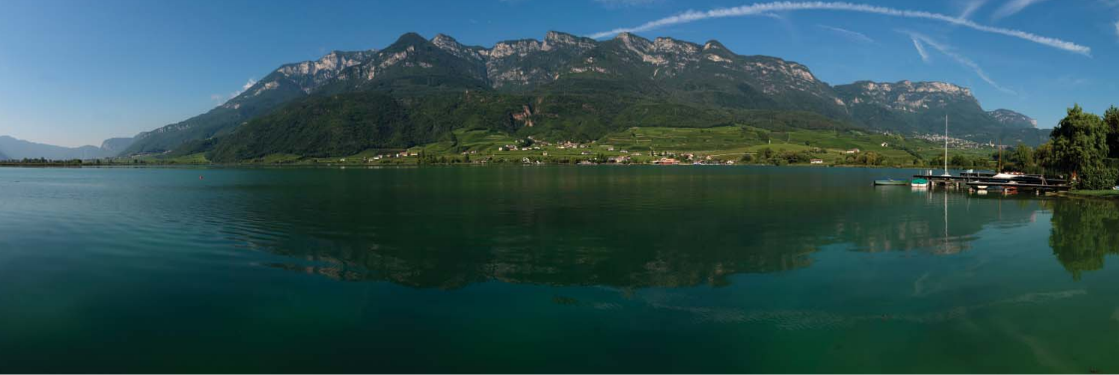
PANORAMICA DAL LAGO La sponda ovest del lago di Caldaro: si notano le case di San Giuseppe al Lago, sulla costa, e di Caldaro, sullo sfondo a destra. Sotto, a sinistra, due vedute del Lido, inaugurato nel 2006; a destra, la centrale via Andreas Hofer. Nella pagina a fianco, da sinistra in senso orario: l'ingresso della cantina Torggkeller, che risale al XVI secolo; la funicolare che porta al Passo della Mendola; una sala della cantina Prima & Nuova.