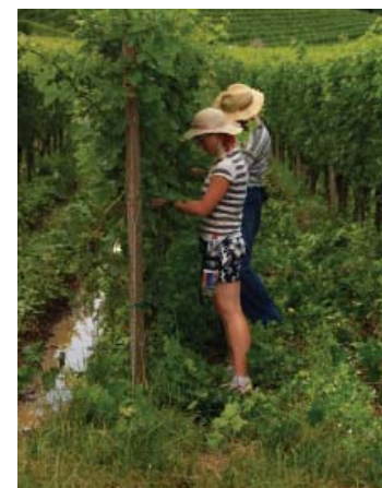
TEMPO DI POTATURA Al lavoro nei vigneti che circondano Caldaro. Nella pagina a fianco, il paesaggio vicino al lago.

grandi quantità di vino economico, non particolarmente pregiato. Negli ultimi decenni la tendenza è radicalmente cambiata, oggi si preferisce puntare sulla qualità, riducendo le rese per ettaro, curando di più i vigneti, sfruttando al meglio la tecnologia in cantina. I risultati di questa rivoluzione enologica sono evidenti: la prestigiosa Guida dei Vini 2009 del Gambero Rosso e Slow Food ha assegnato i tre bicchieri, cioè il massimo del giudizio, a 26 vini altoatesini, 17 dei quali provengono dalla Strada del Vino ( Weinstrasse ).