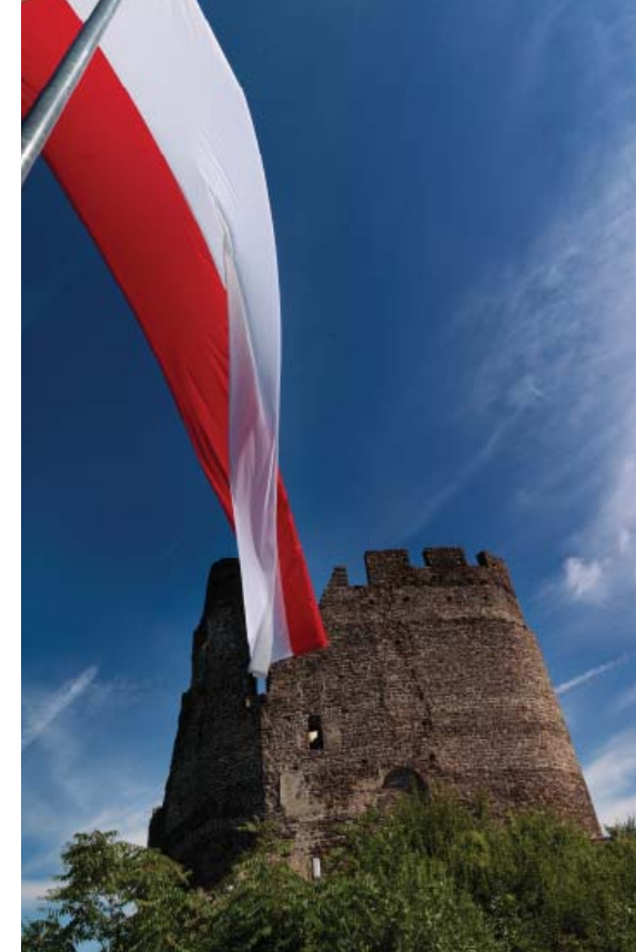
L'ANTICO MANIERO Le rovine di Castelchiaro ; sotto, un forapaglie , tipico uccello del canneto a bordo lago . Nella pagina a fianco, un tratto del Sentiero della Pace .

dida vista del lago di Caldaro e dei vigneti. Si torna per lo stesso percorso.