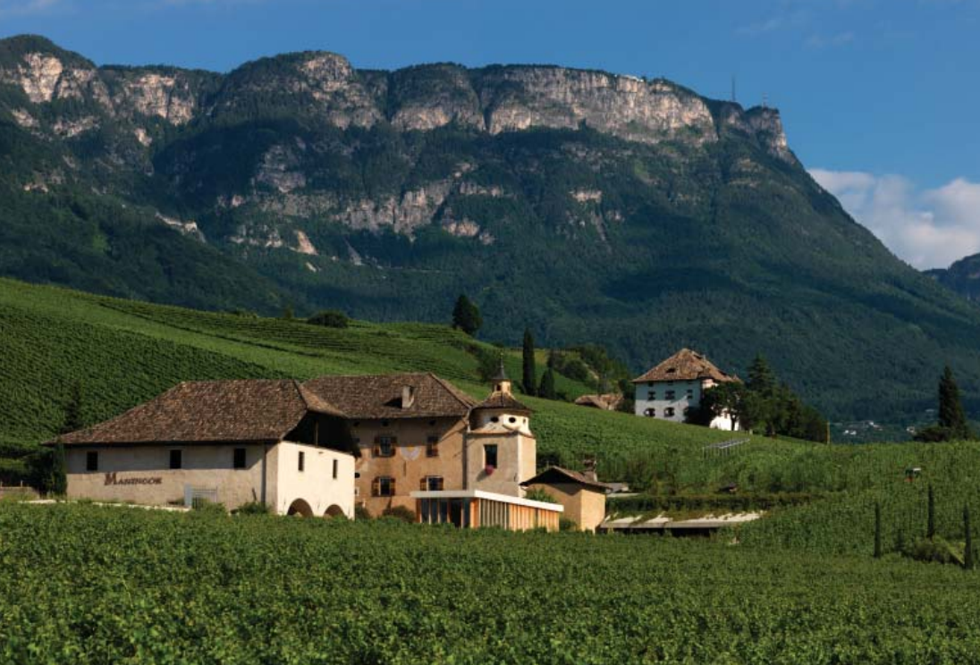
IL PAESAGGIO DELL'UOMO La sede della tenuta Manincor, all'interno di un antico maso ristrutturato, in mezzo ai vigneti: la cantina si sviluppa sotto terra. Sotto, il lago di Caldaro è ideale per cimentarsi con il windsurf.

moderne, di design, come il Winecenter di Caldaro, progettato da una équipe di architetti viennesi che hanno fatto largo uso di vetro e di cemento. La tenuta Manincor, invece, comprende la residenza storica del Settecento e una nuova cantina a più piani, interamente scavata sotto i vigneti, senza alcun impatto visivo sul paesaggio.